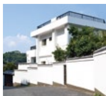
員工第一休閒中心1 (尾道市向島)