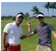
社團活動(高爾夫球社)