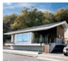
員工第一休閒中心3 (尾道市向島)