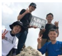
社團活動(戶外自然社)

員工不論在工作上或是在個人的生活上都能充實快樂是JEL最基本的方針。 在充實員工休閒生活上我們也提供了各項的員工福利制度。