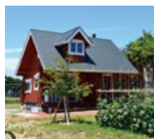
員工第一休閒中心2 (尾道市向島)